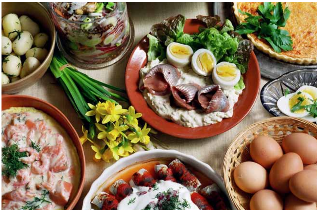
Att anpassa måltiderna efter den äldres önskemål kan innebära att respektera kulturella högtider, smak och tradition.