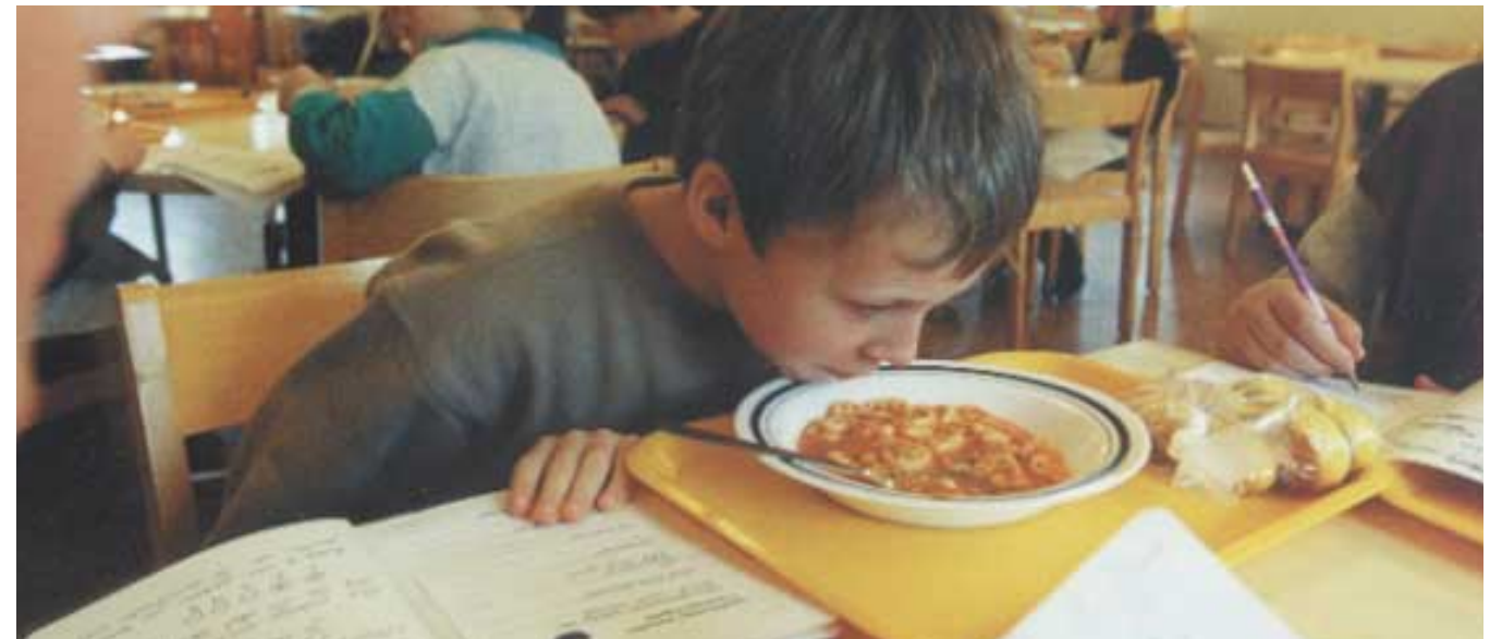
Den basilikakryddade tomatsoppan är en ny rätt i skolmatsalen. Smak och doft undersöks och resultatet skrivs in i smakböckerna