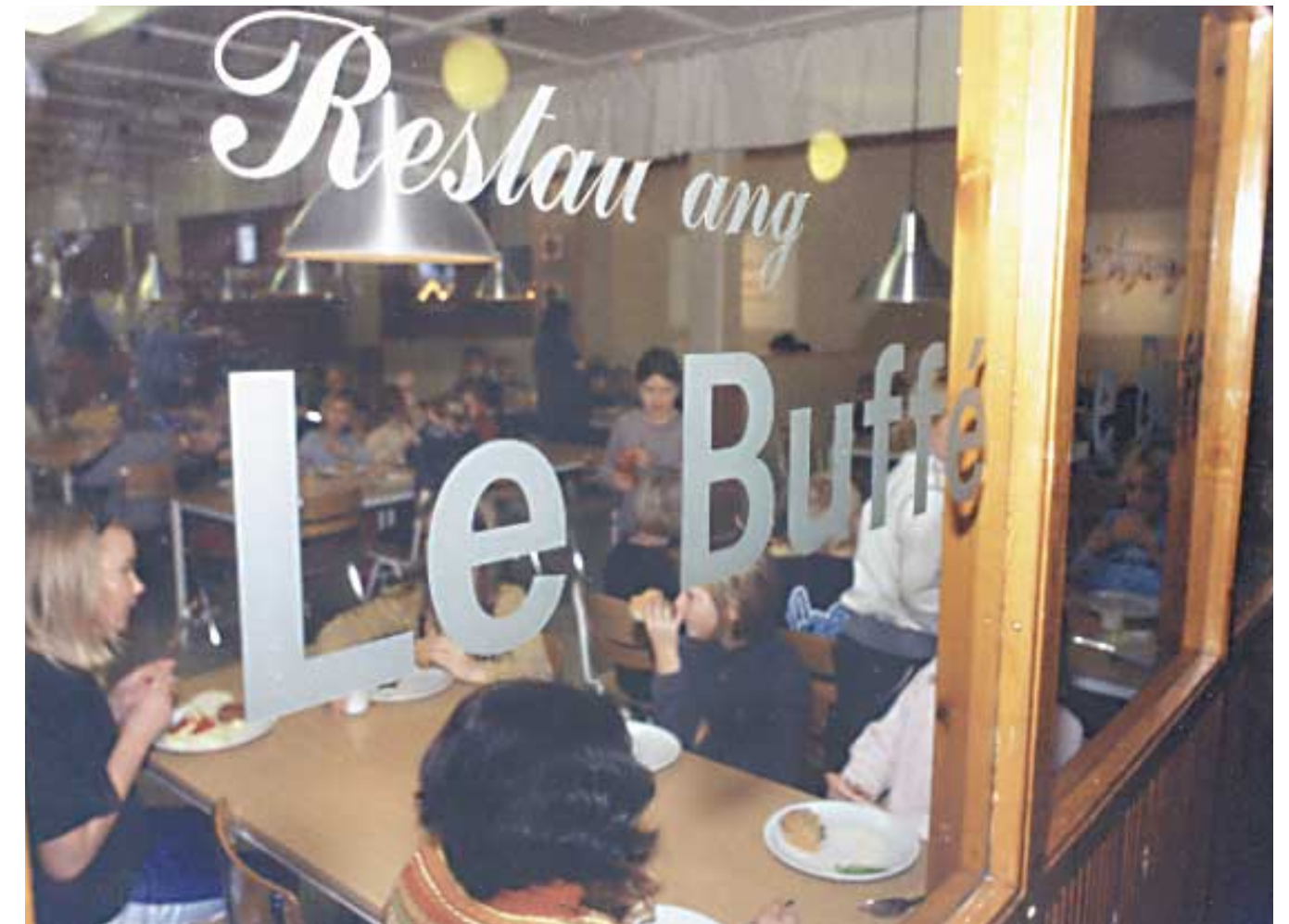
Restaurang Le Buffé på Engelbrektskolan i Borås.