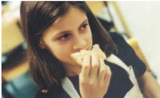
Två brödbitar blindtestas. De smakar olika – men varför? Sina skärps i försöket att hitta svaret.

Idag är det en sådan dag. Det serveras basilikakryddad