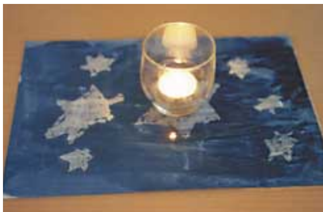
Barnen gör dukar i olika färger som plastas in och läggs på borden för att visa var man ska sitta. Varje grupp har sin färg.

varma rätten, potatis, ris, pasta och sist tillbehör som riven ost eller stark sås i en lång och innehållsrik rad.