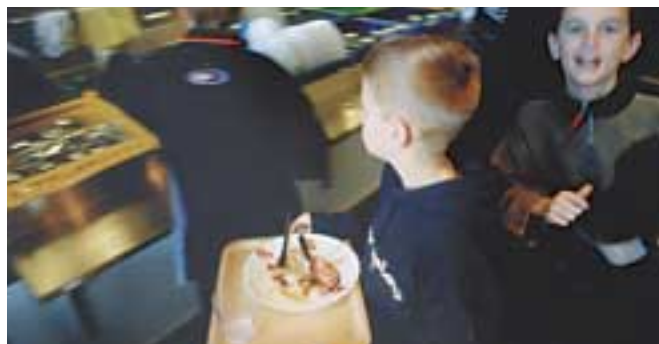
För att underlätta för kökspersonalen sorterar eleverna själva sin disk när de ätit.

På Skogslundsskolan i Surahammar finns ett matråd som består av en elev från varje klass i åttan och nian. Rådet ska vara en kanal för elevernas åsikter och idéer.