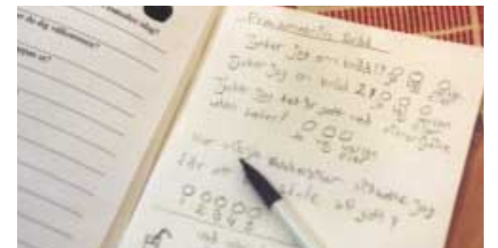
Klass fem i Lillåns skola har egna smakböcker där eleverna skriver ner resultatet av sina smakprov.

– Maten i den här skolan är ganska hygglig, faktiskt.