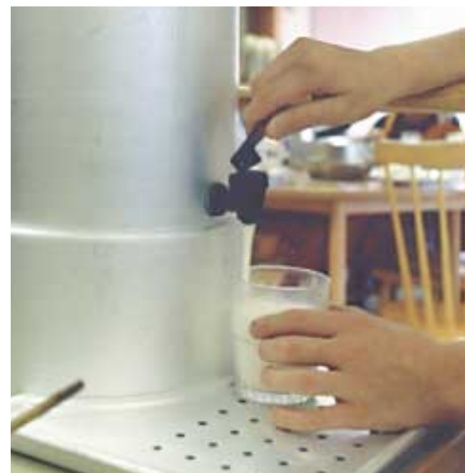
Barnen serverar sig själva, både mat och mjölk eller annan dryck.

Barnen verkar gilla pannbiffen. De smaskar i sig med god aptit och tar gärna mer. Samtalstonen är lugn, ingen har bråttom. De vet att de hinner med att både äta och leka.