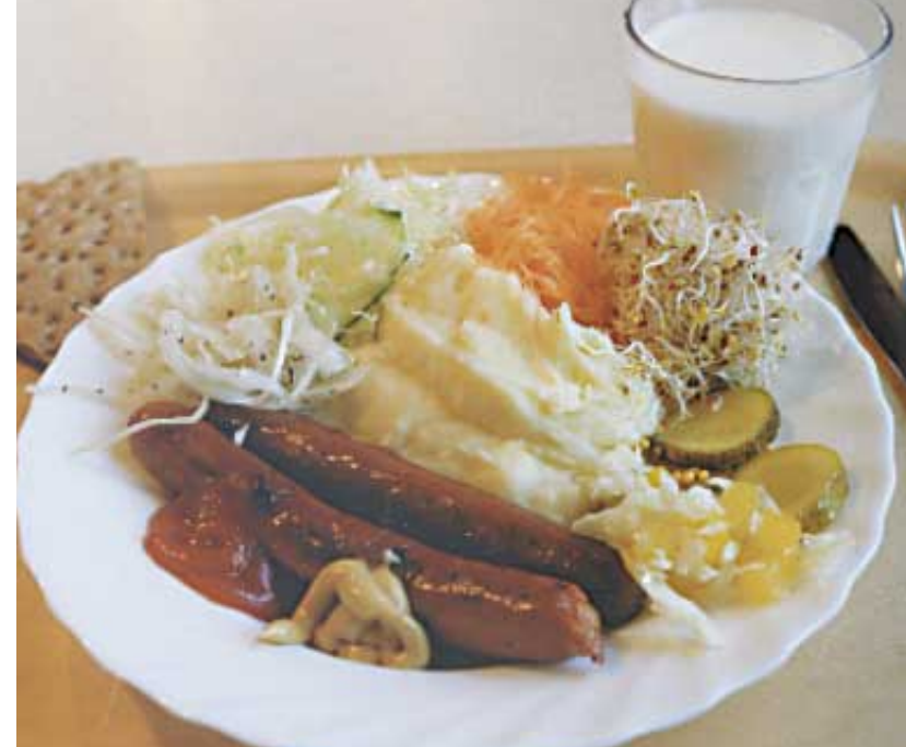
Dagens meny på Skogslundsskolan: Grillkorv med potatismos, med rejäl sallad och mjölk.

I köket och matsalen har en del miljöförbättrande åtgärder genomförts. En disk med självplock, där eleverna själva sorterar disken i olika backar, finns sedan en tid. Dessutom har köket en ny grönsaksskärare för bland annat morötter. Ute i