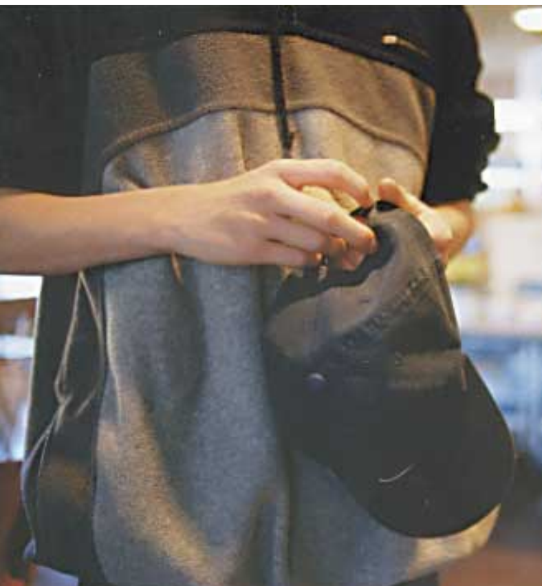
Kepsförbud råder i matsalen.