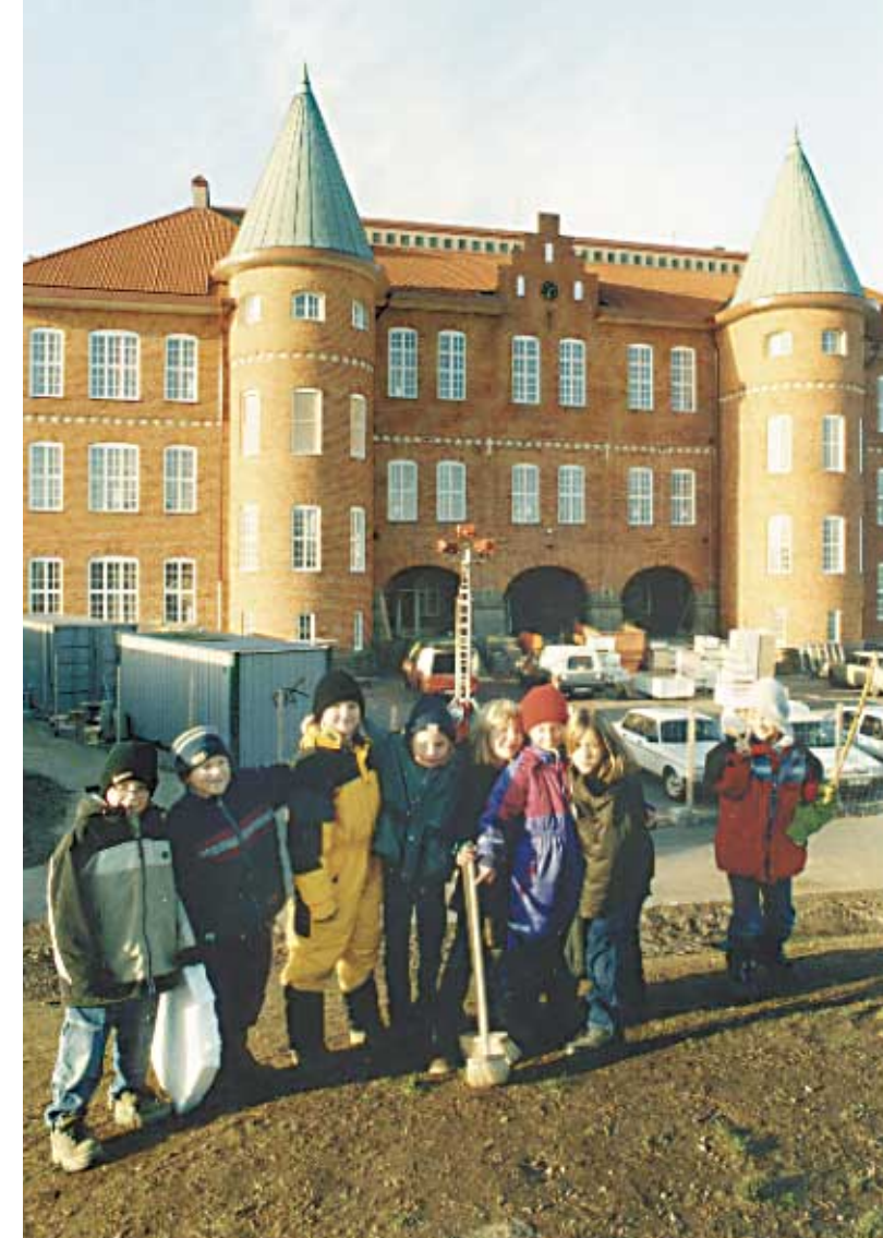
Marieborgsskolan, en skola som ser ut som ett slott.

Kom också ihåg att mathantering lyder under livsmedelslagen. Miljö- och hälsoskyddsmyndigheten (eller motsvarande) ska därför ge sitt medgivande till hanteringen.