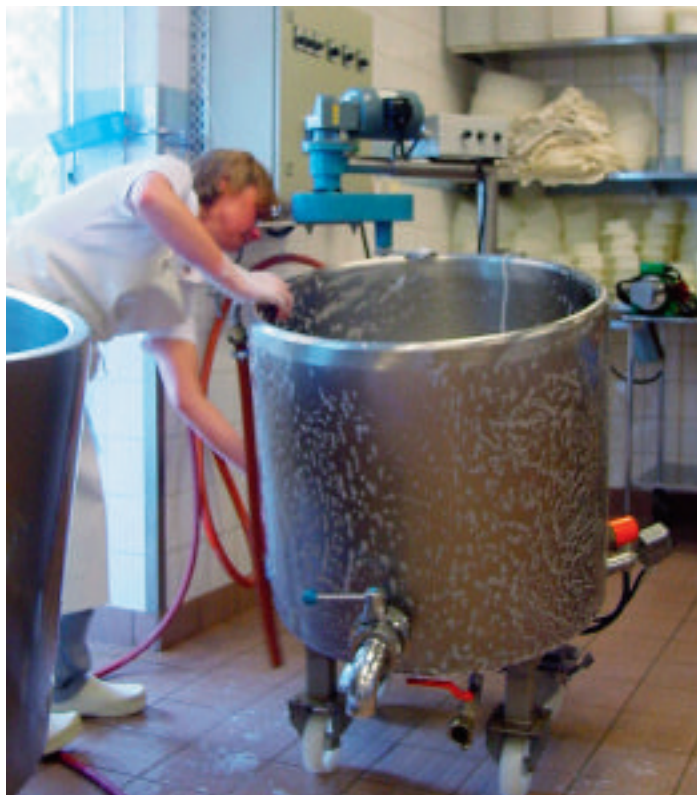
Rengöring är en viktig del av grundförutsättningarna.

Många av företagen förädlar råvaror från den egna gården. De ystar ost av mjölk från sina egna får, getter och kor, tillverkar korv av griskött från grisar som de själva har fött upp och bakar bröd av eget spannmål.