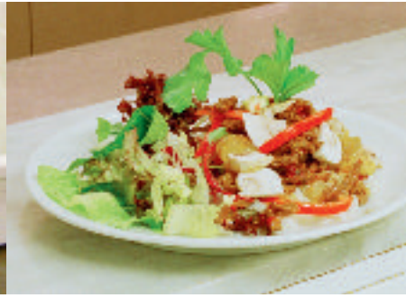
Mat ska vara säker.