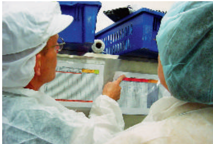
Uppföljning av rengöringsschema.

Metoden innebär att man systematiskt går igenom hela processen, analyserar och värderar de hälsofaror som finns med det enskilda livsmedlet och styr processen så att riskerna elimineras eller minimeras. Farorna delas upp i biologiska (bakterier, mögel, virus eller parasiter), kemiska (t ex rester av rengöringsmedel), fysikaliska (glas och metallbitar) och allergena (nötter och äggprotein).