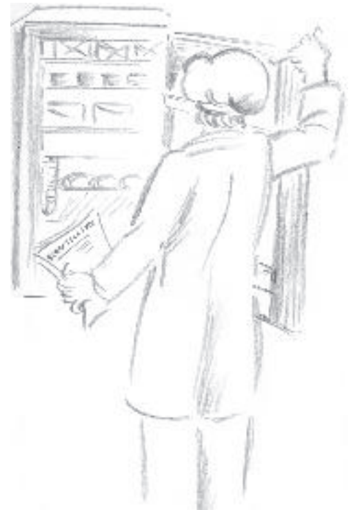
Med egenkontroll håller du ständigt koll.