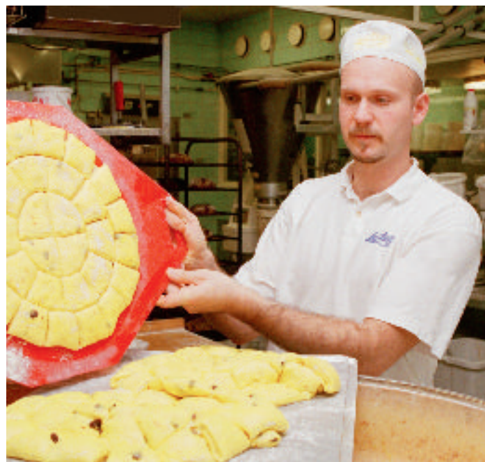
Medarbetarnas kompetens och utbildning är grunden för trygghet och kvalitet.

Kontakta din branschorganisation för att få tips på lämpliga kurser i att göra egenkontrollprogram.