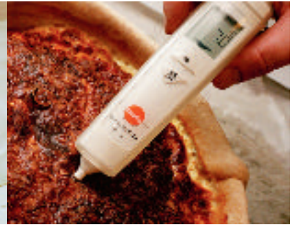
Övervakning med hjälp av temperaturmätning.