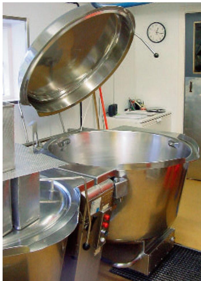
Släta, blanka ytor är en förutsättning för en effektiv rengöring.