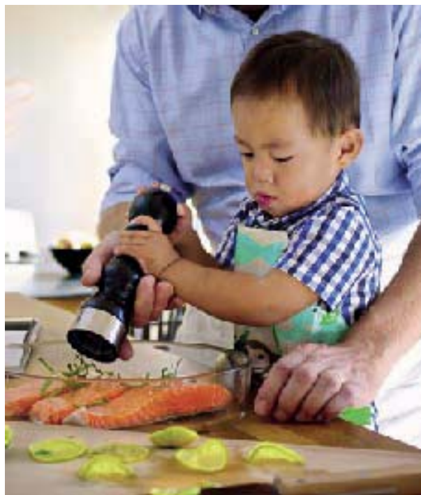
Šukar i e čhvenge te han često mače, 2-3 far ko kurko.

Sastrn tano jekh ishranlivo elementi so tano pharo e tikne čhvenge te ovel dovolno. Razno kaše barvale sastrnea tane odoleske šukar isto kedao čhave tane duj berš. Mas, krvavica, maro kjerdo taro raži hem kote so dodainelape rat hem javer ratvalo hajbe tane barvale ko sastrn. Gravo, grašako, sočivia, tofu hem disave lešnikia hem semetane vegetabilikane sastrneskere izvorio.