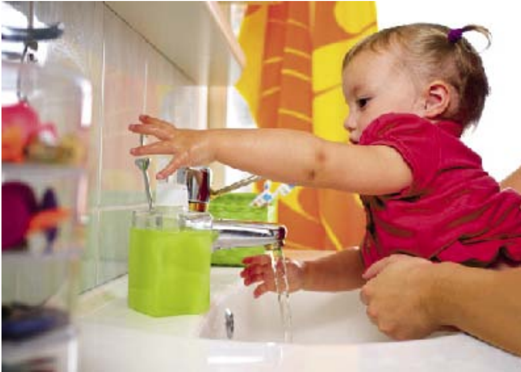
De tut ekstra godi higienake keda ka kjere hajbaske e čhavea hem e čhaveske