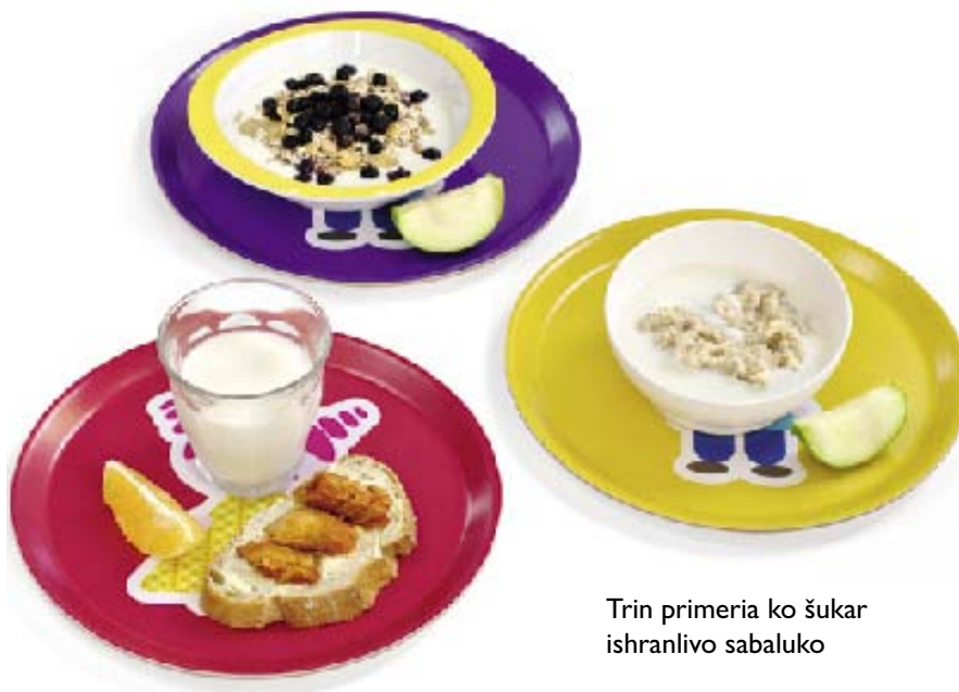
Trin primeria ko šukar ishranlivo sabaluko

Biposeimo varo hem fibria tane šukar tikne čhavage, ama čhave potikne taro duj berš šaj te dobinen proliv te dindžape but akava. Javere čhavage šaj te ovel obratno, ola tane zorale ko vodži. Kobor but fibria o čhave šaj te han bizo o vodži te dukhal olen variriranela taro čhavo ko čhavo- valjani te probine. Jekh šukar čani tano te halpe odmereno fibria te šaj te varirinelpe maškar biposeime produktia hem pohari fiberbarvale vrstia.